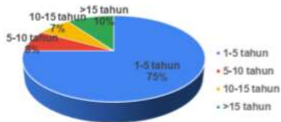
Gambar 4.2 Berdasarkan Lamanya Pengalaman Kerja

Berdasarkan hasil pengumpulan data melalui kuesioner terhadap 100 responden, diperoleh informasi bahwa mayoritas responden memiliki pengalaman antara 1-5 tahun dalam merancang bangunan hunian bertingkat tinggi, dengan persentase sebesar 75%. Sementara itu, sebanyak 10% responden memiliki pengalaman >15 tahun, diikuti oleh 8% responden yang telah berkecimpung selama 5-10 tahun dan sisanya, yaitu 7%, memiliki pengalaman 10-15 tahun. Distribusi pengalaman ini memberikan gambaran awal mengenai tingkat keterlibatan profesional responden dalam bidang perancangan bangunan tinggi.