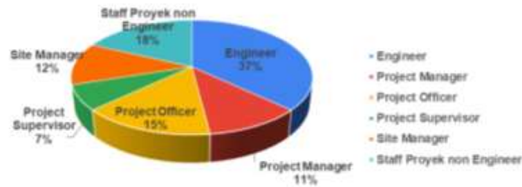
Gambar 4.3 Berdasarkan Peran Responden