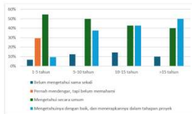
Gambar 4.5 Pemahaman Responden Terhadap Konsep Berbagi Pengetahuan

Berikutnya dijelaskan pemahaman konsep berbagi pengetahuan pada pengalaman 5-10 tahun. Pada kelompok dengan pengalaman 5–10 tahun, proporsi penerapan meningkat signifikan hingga 38%, meskipun mayoritas tetap berada pada kategori mengetahui secara umum (50%). Dan hanya 12% belum mengetahui sama sekali. Berikut dijelaskan pemahaman konsep berbagi pengetahuan pada pengalaman 10-15 tahun. Kelompok dengan pengalaman 10–15 tahun menunjukkan keseimbangan antara awareness dan penerapan, masing-masing sebesar 43%, menandakan adanya kematangan pemahaman. Dan 14% belum mengetahui sama sekali. Berikutnya dijelaskan pemahaman konsep berbagi pengetahuan pada pengalaman >15 tahun. Pada kelompok dengan pengalaman lebih dari 15 tahun memiliki tingkat penerapan tertinggi, yaitu 50%, dengan 40% mengetahui secara umum dan hanya 10% yang belum mengetahui sama sekali. Secara keseluruhan, data ini memberikan gambaran umum mengenai semakin tinggi pengalaman kerja, semakin besar kemungkinan/kecenderungan seseorang memahami dan menerapkan konsep berbagi pengetahuan, sehingga strategi peningkatan awareness dan penerapan perlu disesuaikan dengan segmentasi pengalaman kerja.